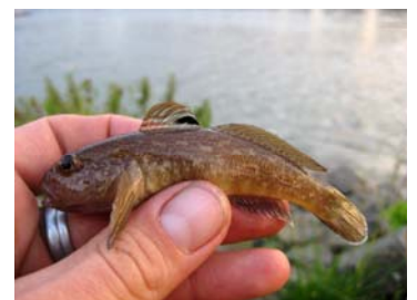
Die Schwarzmundgrundel ist eingewandert und überträgt Parasiten