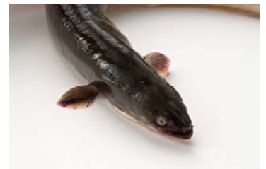
Wird in Europa immer seltener: Der Edelspeisefisch Aal